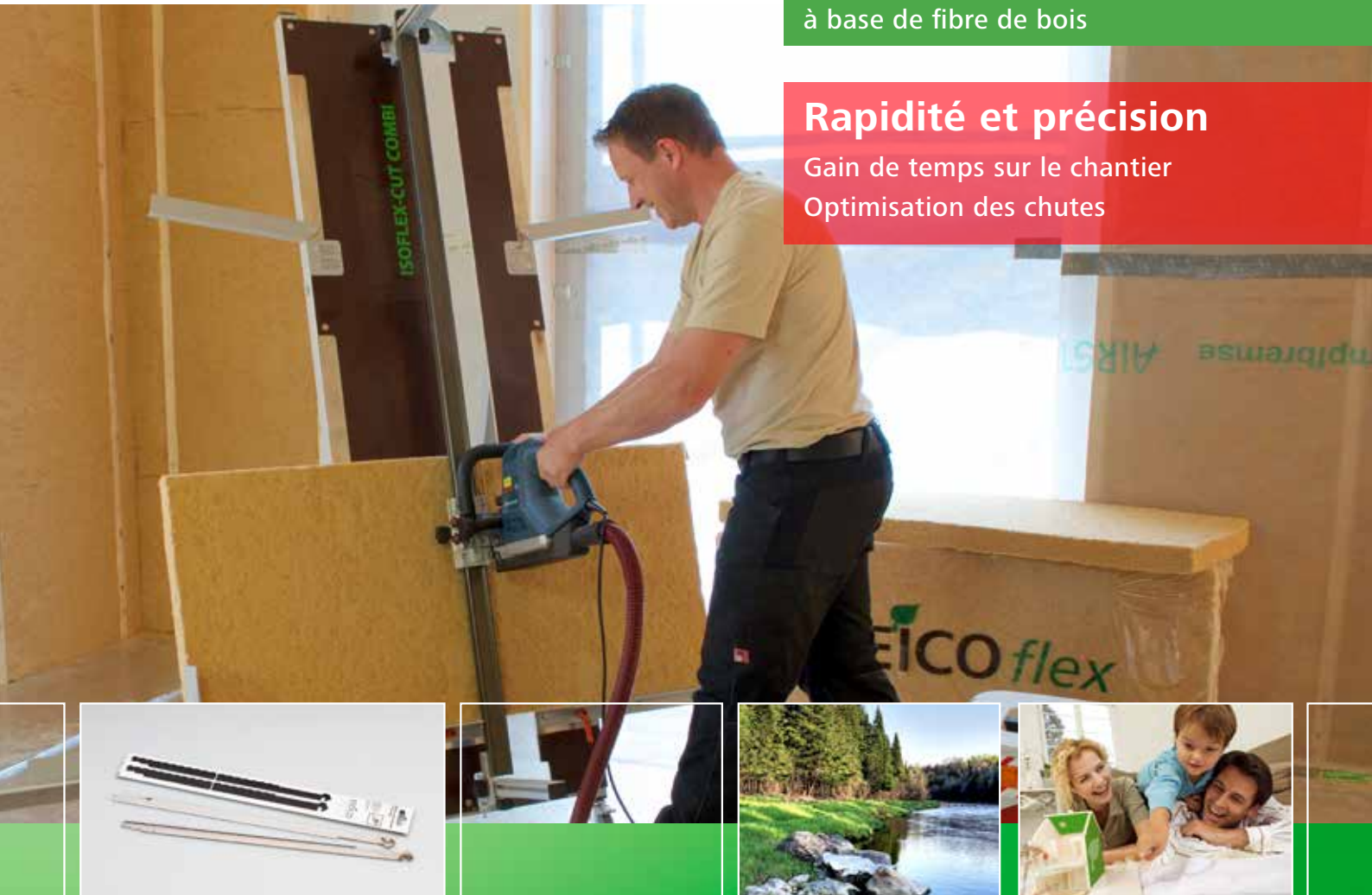
Table de coupe pour isolants rigides et semi-rigides

Gain de temps sur le chantier Optimisation des chutes